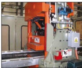
Станция вырубki с высоким усилием